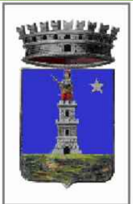
Tavola 2.1 A Elaborato n.

UFFICIO REGIONALE ASSESSORATO ALL'URBANISTICA PIANO URBANISTICO COMUNALE GENERALE in variante al P.R.G. adottato con Deliberazione del C.C. n. 19 del 19/05/1999 (ai sensi della L. Reg. Lazio n. 38/1999 e smi)